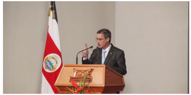
El presidente del TSE, Luis Antonio Sobrado, dio un discurso crítico el 2 de octubre al abrir la campaña.

Ampliar ( http://www.nacion.com/nacional/politica/TSE-Antonio-Sobrado-JOSE-ARCE_LNCIMA20131006_0073_1.jpg )